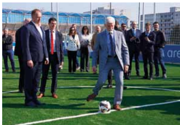
Prezident Petr Pavel si prohlédl novou FIFA arénu v areálu mladoboleslavského Městského stadionu, která je přístupná široké veřejnosti, tedy i lidem z Kosmonos.

INZERCE: Nálezce svazku klíčů ztracených v oblasti Prondo/veterina v Kosmonosech může odevzdat klíče na MÚ Kosmonosy. Nebo prosím volejte 602 475 620.