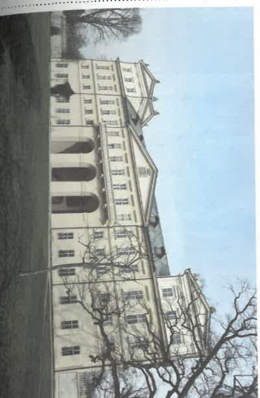
Jedním z míst, kde bude umístěna retenční nádrž, je prostor před Sala Terrenou. Druhým prostorem před budovou kosmonoského zámku.