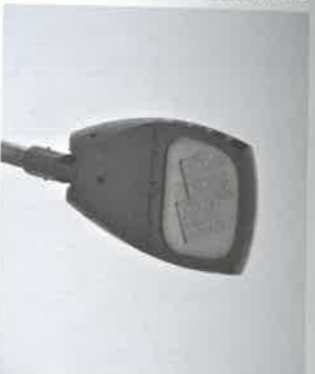
První etapa modernizace svítidel proběhla v Kosmonosech.