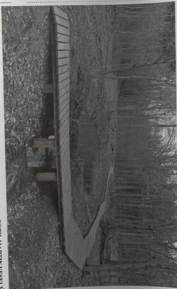
V Kosmonosích finišuje třetí etapa revitalizace Obory. Dokončuje se například síť stezek