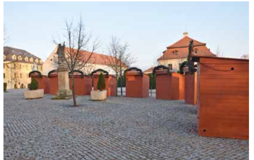
Při vánočních trzích budou mít premiéru zrenovované stánky.

se určitě návštěvníkům a také prodej- : cům budou zamlouvat. Vánoční trhy : doprovodí vystoupení dětí z kosmo- : noské základní školy a mateřských : škol. Těšit se můžete na pekelné ná- : dvoří, čertovské dílničky a nadílku. (pp)