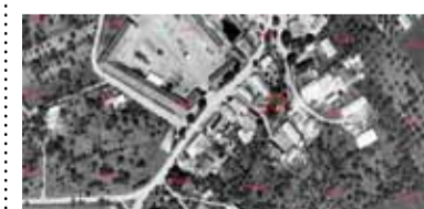
Objekt „haltýře“ na historickém leteckém snímku 1938.

cest. Dnes se dochovaly jen ojediněle, většinou ve skanzenech či muzeích v přírodě. Do výroby haltýřů se často používalo roubení, ale také kámen. Střechy byly různé, některé haltýře měly sedlovou, jiné valbovou střechu, někdy pokrytou šindelem nebo jinou tradiční krytinou. S příchodem elektrických chladniček v 20. století začaly haltýře postupně mizet. Mnohé byly zbourány po polovině 20. století, protože již nebyly praktické pro moderní potřeby. Podle NPÚ (Národní památkový ústav) jsou haltýře součástí lidové architektury, která je v některých regionech, například na Vysočině, jednou z nejohroženějších kategorií staveb.