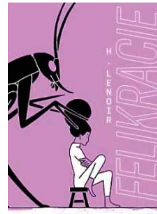
PREKLAD – SARA VYBĚRALOVÁ

Pokud si stále nejste jistí, zda se do knih pustit, v rozhodování vám mohou pomoci tyto oficiální anotace.