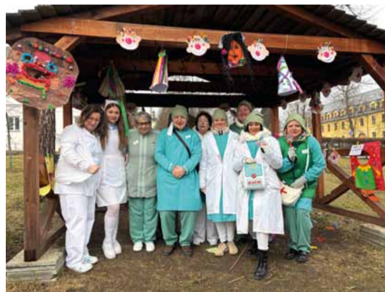
Fotogalerie Kosmonoského masopustu 2026