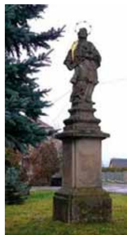
Zvonice, kostel sv. Havla a socha sv. Jana Nepomuckého.