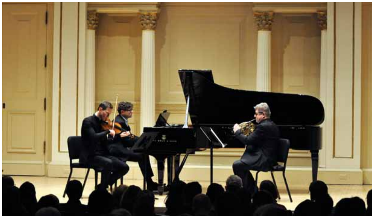
Autor: Brett Iannucci/PARMA Recordings

Bydlíme kousek od Volnočasového areálu Obora park Kosmonosy a