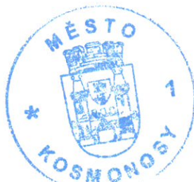
otisk kulatého úředního razítka