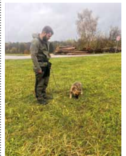
Fotogalerie nové kynologické organizace v Kosmonosech.