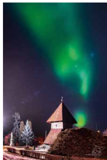
Lednová polární záře v Kosmonosech zachycená Ing. Josefem Egertem a Lubošem Plachým. Bohatou fotogalerii a článek najdete uvnitř tohoto čísla.