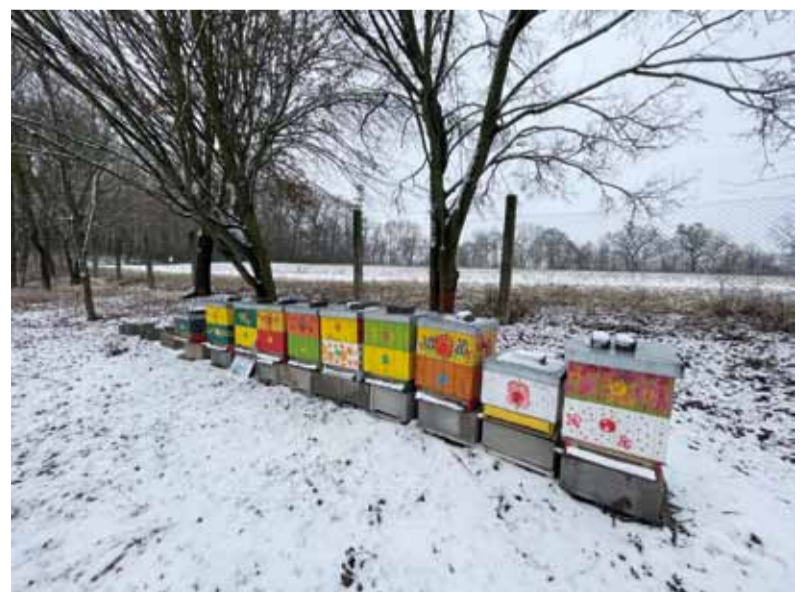
O svou medovou vášeň se s námi podělila kosmonoská včelařka Lucie Kakasová.