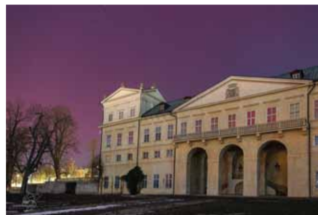
Polární záře zachycená v Kosmonosech, na Bradlecích a v Horních Stakorech.