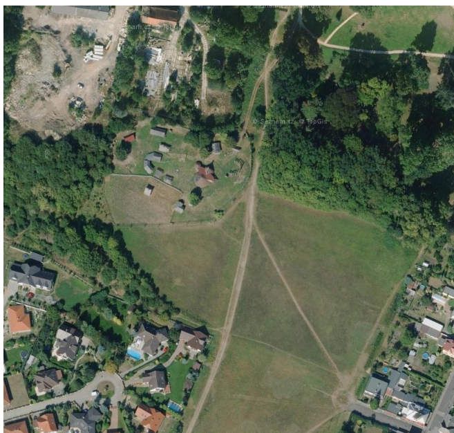
Drobná struktura zástavby – park pod zámekem Kosmonosy