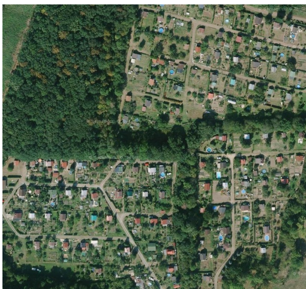
Rozvolněná drobná struktura zástavby – zahrádkové osady na západním okraji Kosmonos