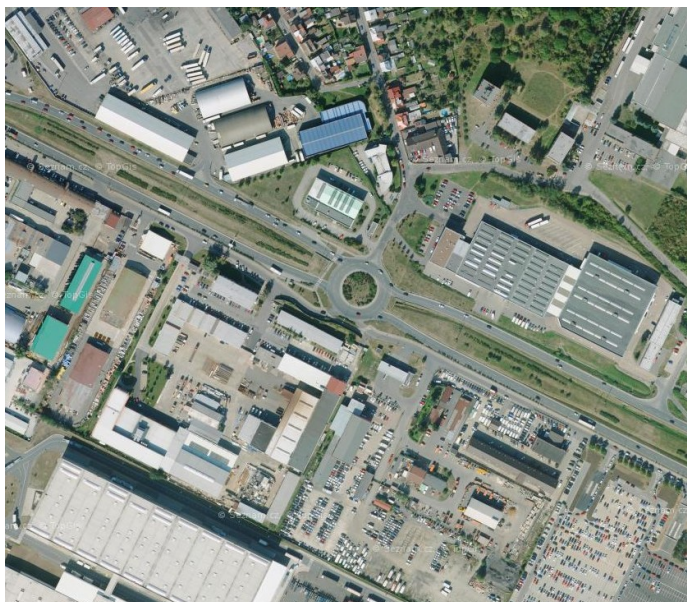
Areálová struktura zástavby – výrobní areály podél ul. Průmyslová