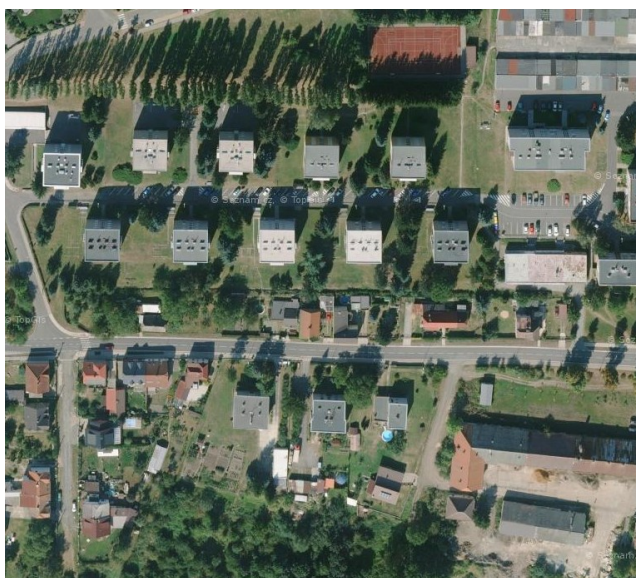
Volná struktura zástavby – bytové domy v ul. Debřská a Pod Koupalištěm