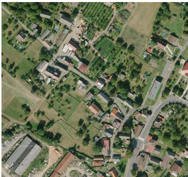
Rozvolněná struktura zástavby – smíšená venkovská zástavba v části Horní Stakory